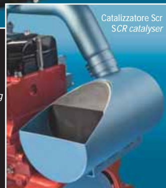
Catalizzatore Scr SCR catalyser

Il propulsore 84 CTA da 8,4 litri e 370 CV, a 6 cilindri con 4 valvole per cilindro, è stato il primo motore con sistema Scr destinato all'impiego agricolo/ Sisu's 8,400 cc, 370 HP 84 CTA engine, with six cylinders and four valves per cylinder, is the first power unit using SCR technology to be installed in a tractor